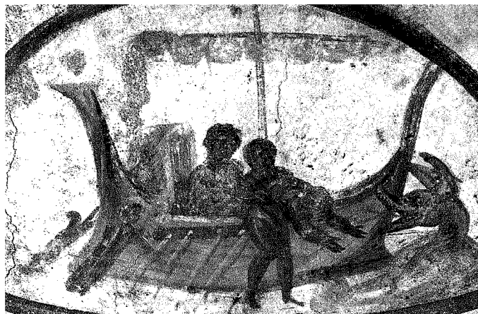
Un particolare delle Storie di Giona , (100-200 d.C.) raffigurato sull'affresco della volta delle catacombe dei Santi Pietro e Marcellino a Roma