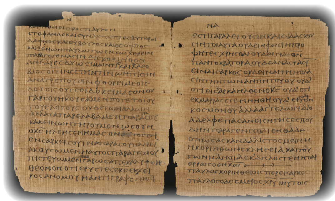
PB C, P. Bodmer X - Fondation Martin Bodmer, numérisation Bodmer Lab, UNIGE